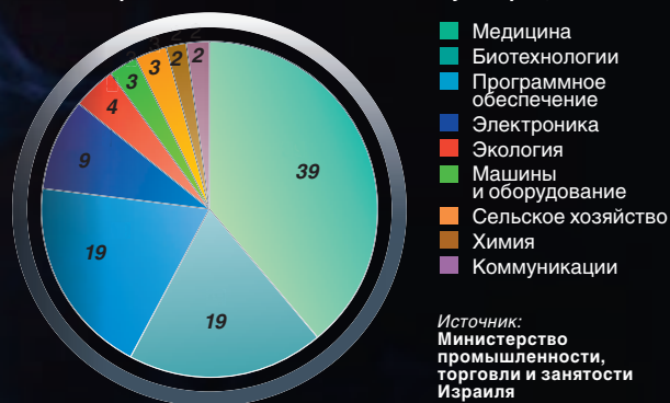
Здоровый образ Соотношение стартапов различных отраслей в израильских технологических инкубаторах, %