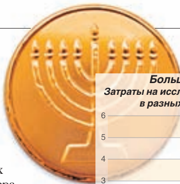
Больше всех надо Затраты на исследования и разработки в разных странах, % ВВП